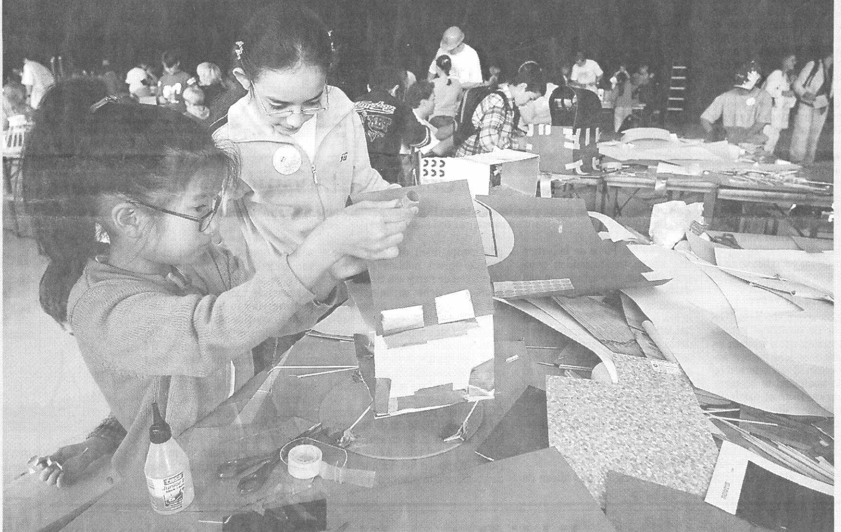
Rotterdam Bouwt: het leverde de mooiste bouwsels op.

Rotterdam — Architectuur zit een beetje in de Rotterdamse genen. Het stroomt hier door de aderen, of je nou uit Kralingen komt of uit Feijenoord. Dat bleek gisteren wel tijdens Rotterdam Bouwt, een architectonische ontwerpwedstrijd voor kinderen tussen de zeven en twaalf jaar. Natuurlijk georganiseerd in het kader van de Architectuur Biennale.