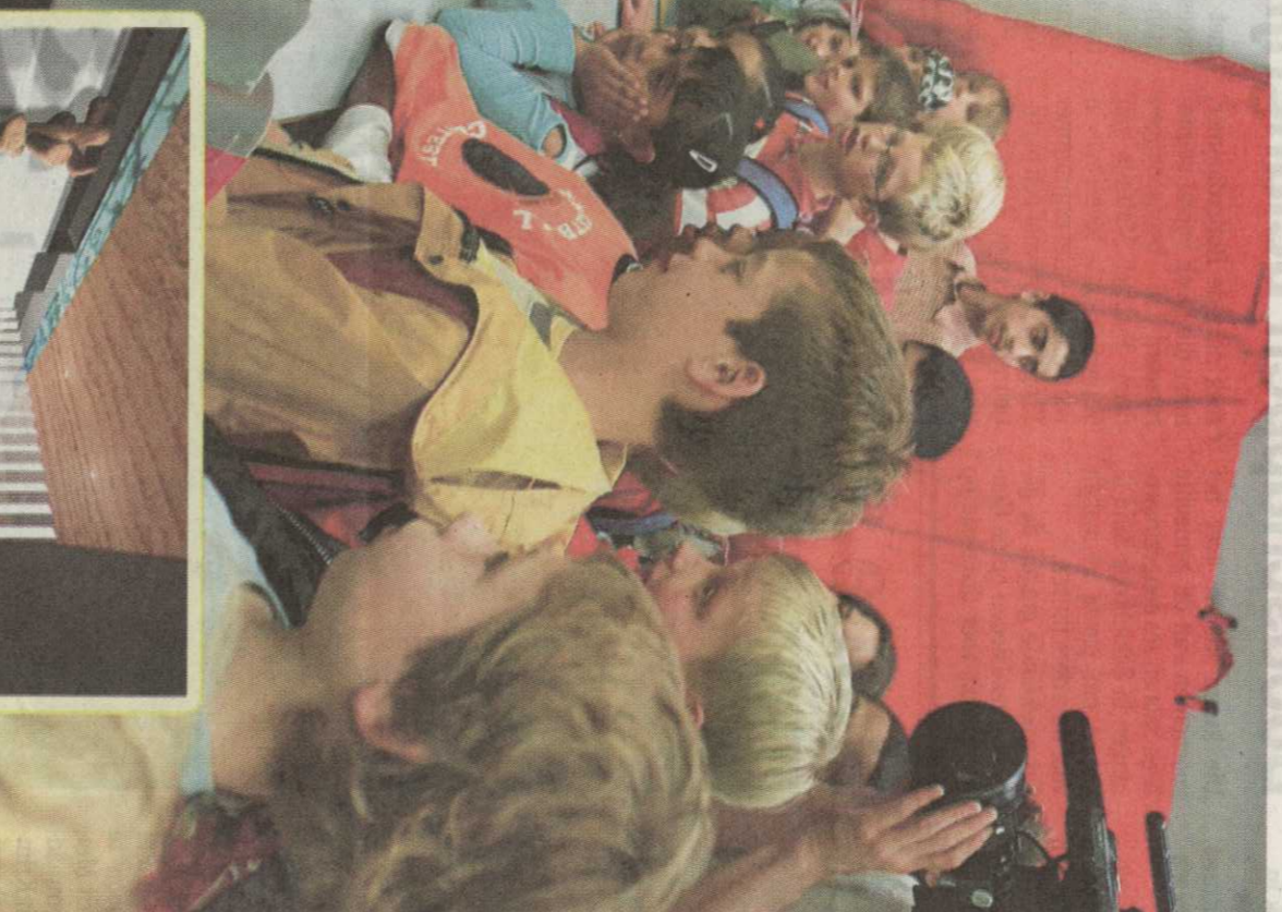
In de hal van het Sophia knutselden patiënten van het ziekenhuis, maar ook kinderen van het personeel aan fabelachtige maquettes. Ze bogden zich onder andere over de vraag hoe een healing environment eruit moet zien.

In de hal van het Erasmus MC Sophia knutselden enkele tientallen kinderen zondag met het puntje van de tong naar buiten aan de fabelachtigste maquettes.